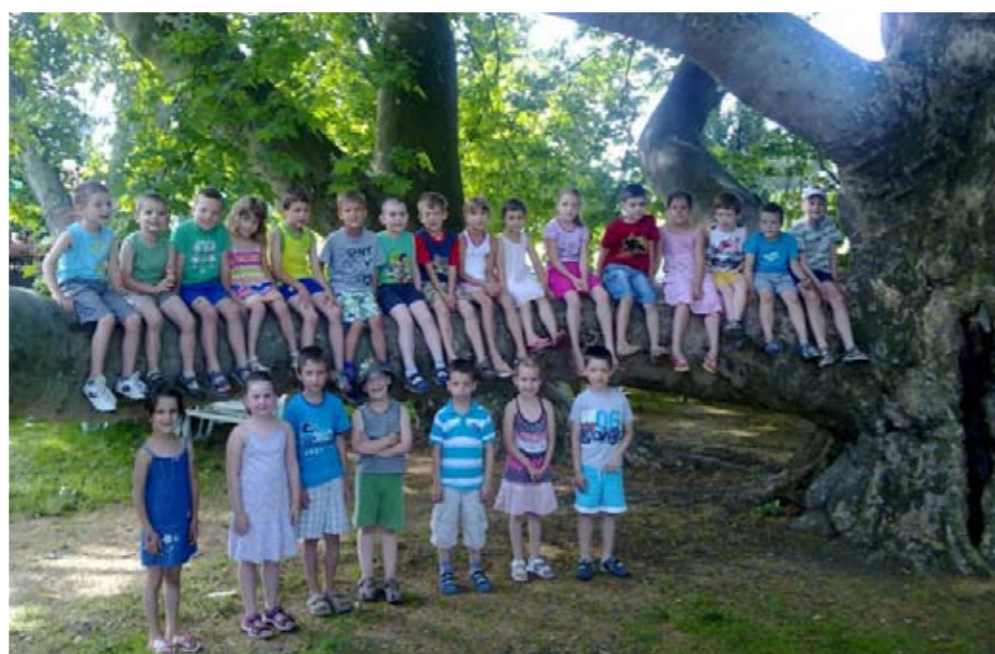
„Minden emberben fa lakik, ágaira fészkel a hit...”

versenyeztetik egymással. Történetük és az őket támogató erős közösségi szimpátia a mérce. A verseny felhívta a figyelmet a természeti, kulturális és történelmi örökségünk védelmére. A döntőbe jutott fák – állítja a főkéntés – különleges erővel bírnak: összetartják a körülöttük élőket, közösséget teremtenek. „Platánunk ugyanúgy