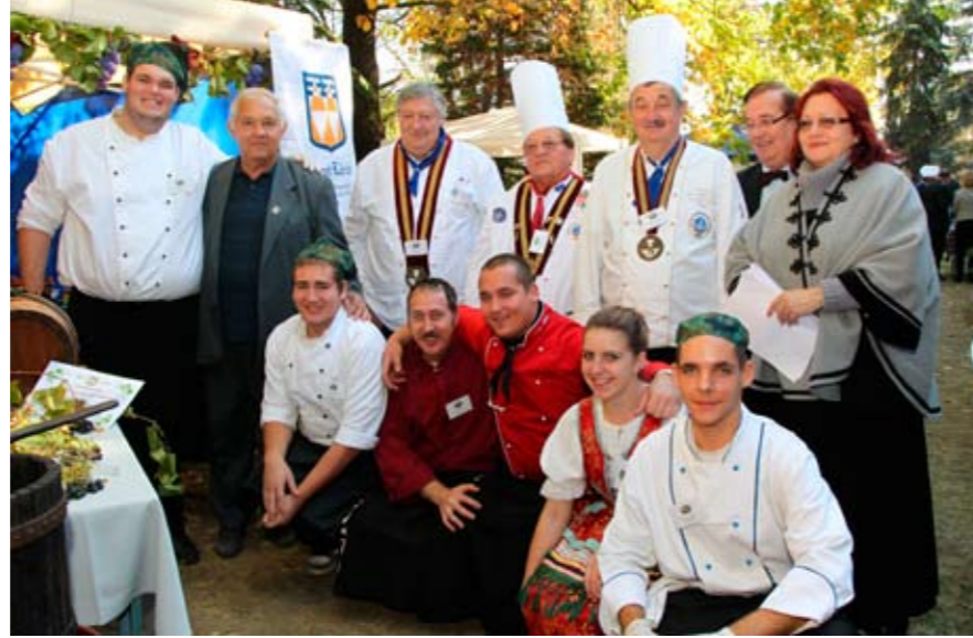
A Pincebetyárok csapat tagjai és a zsűri

Az iskola nagy hangsúlyt fektet a gyakorlatorientált képzésre, ezért olyan elismertek és kéréssek – itthon és külföldön egyaránt – a Szent Lőrincben végzett fiatalok.