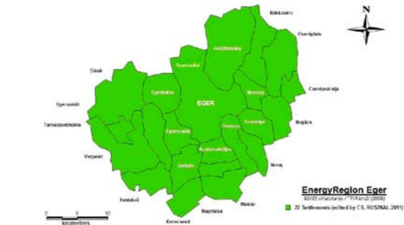
A modellrégió, a kutatás mintaterülete

Ezért döntöttünk úgy, hogy a német Kasseli Egyetem közreműködésével a megújuló energiaforrások és a klímaváltozás területén célzott alapvető kutatásokat elvégeztetésre fogunk. A kutatásra épülve térségi geoinformatikai (GIS) adatbázist hozunk létre. Továbbá kidolgozzuk a hozzá kapcsolódó